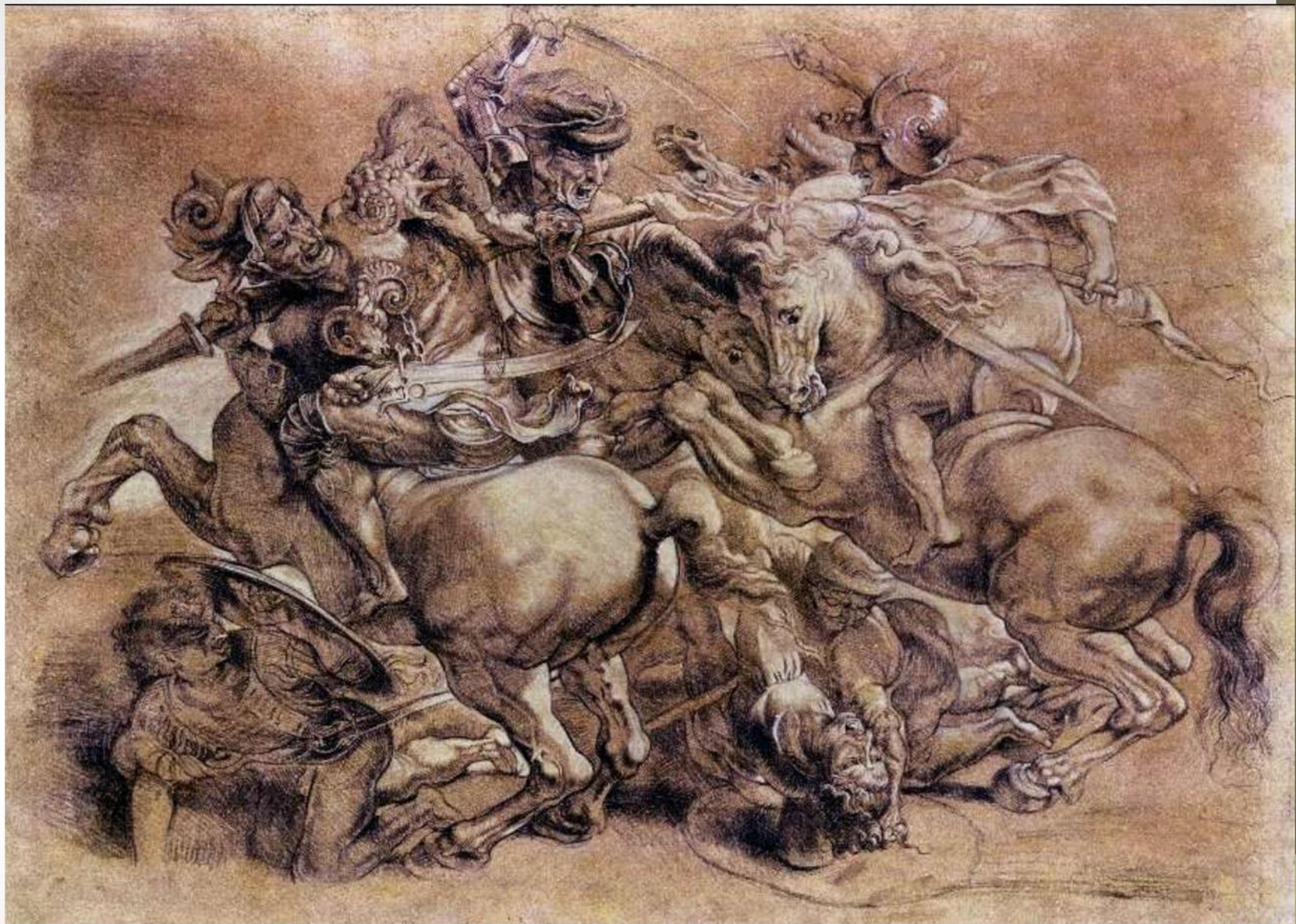
Леонардо да Винчи. Битва при Ангиари. 1504