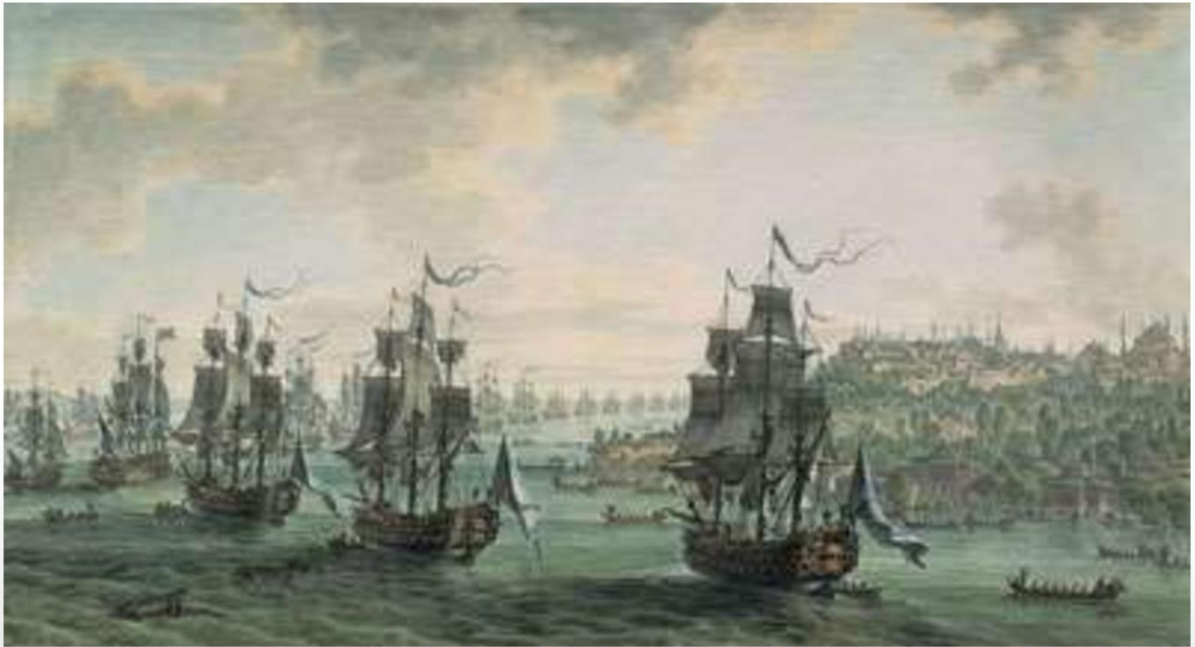
Российская эскадра под командованием Ф.Ф. Ушакова

Уверовал в то, что искусство должно служить ... Сохраняя связь с традициями классицистического монументализма, Иванов закладывает черты реалистического метода.