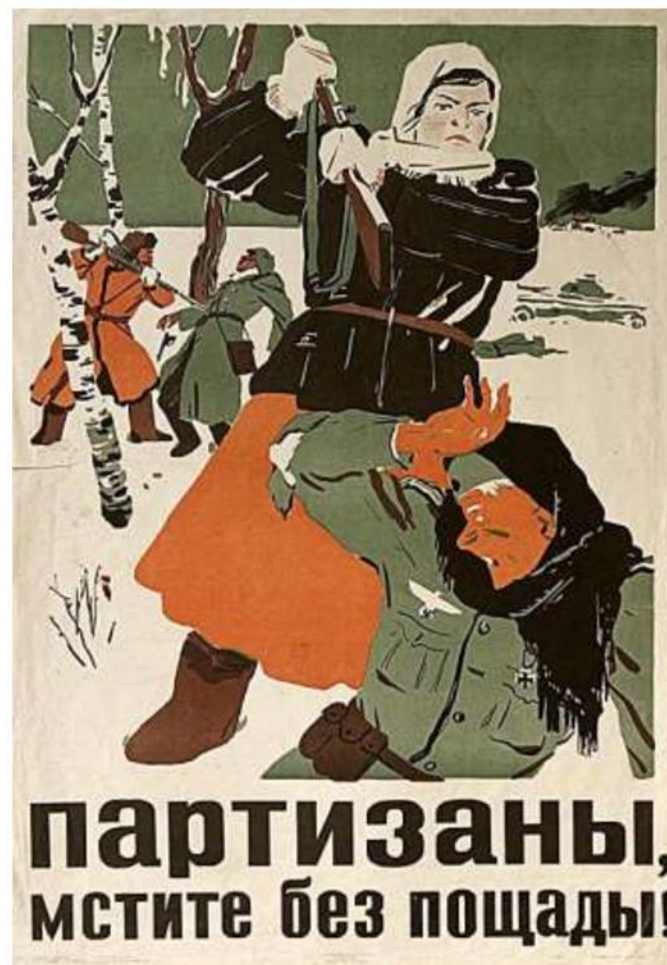
«Партизаны, мстите без пощады!» (Т. Еремин)