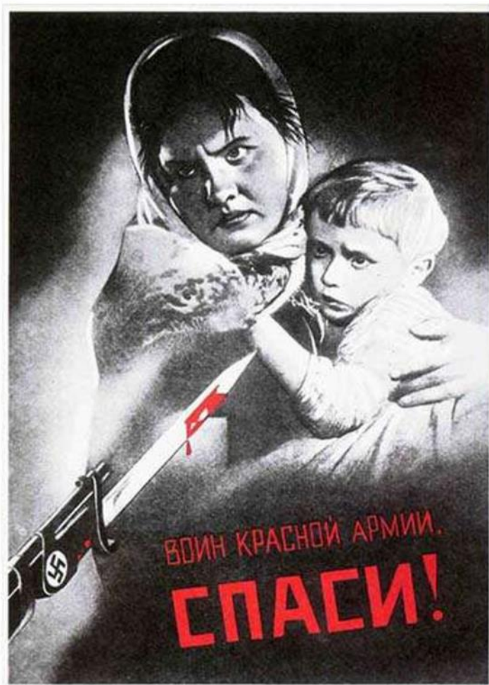
«Воин Красной Армии, спаси!» (В. Корецкий)

Духом военного времени было проникнуто творчество художников и скульпторов. В годы войны получили широкое распространение такие формы оперативной наглядной агитации, как военный и политический плакат, карикатура.