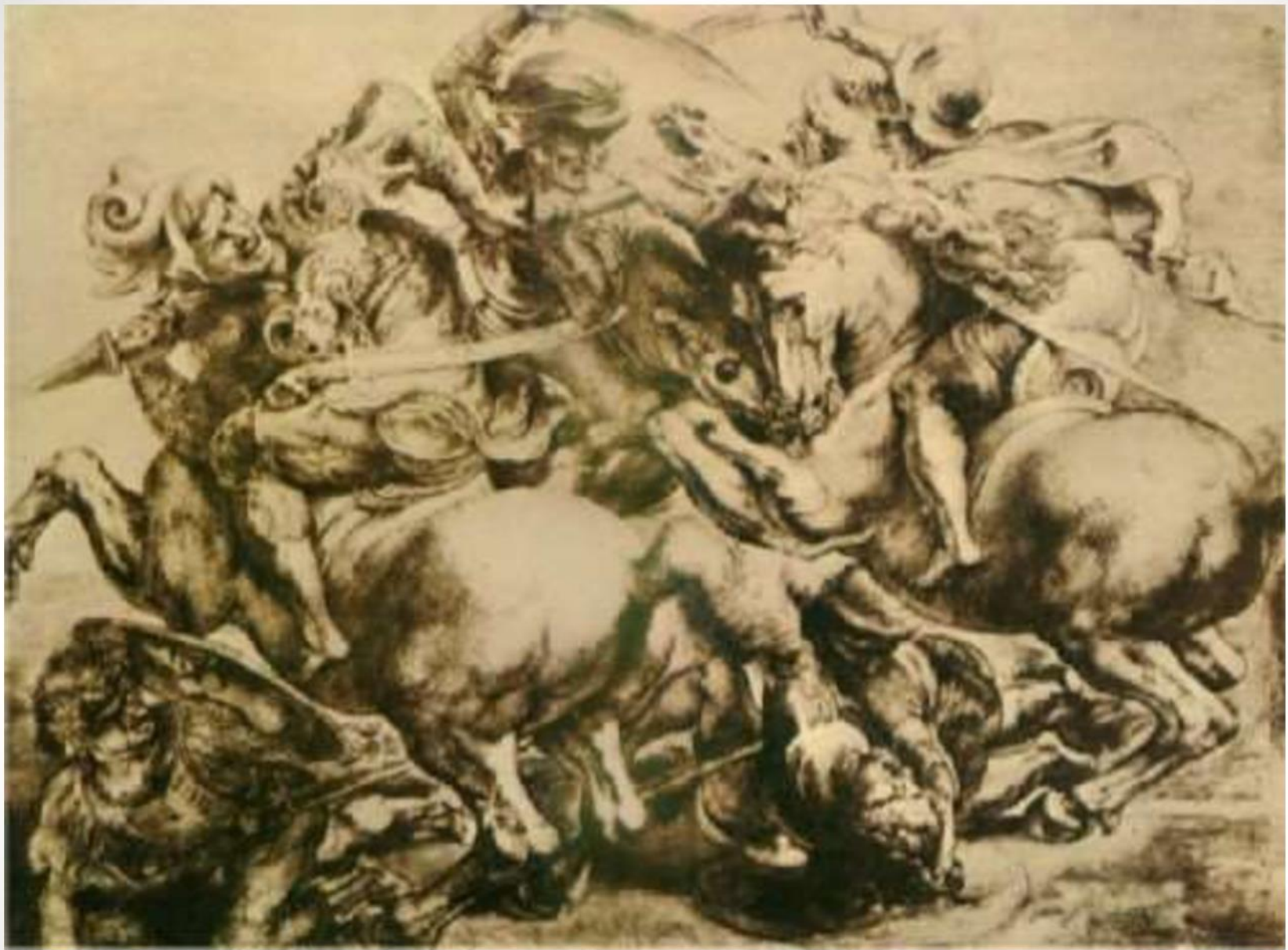
Микеланджело Буонарроти. Битва при Кашине. 1504-1505 гг. Фрагмент