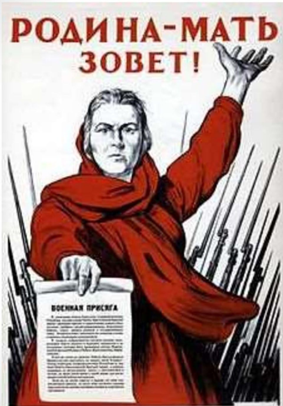
«Родина-мать зовет!» (И. Тоидзе)