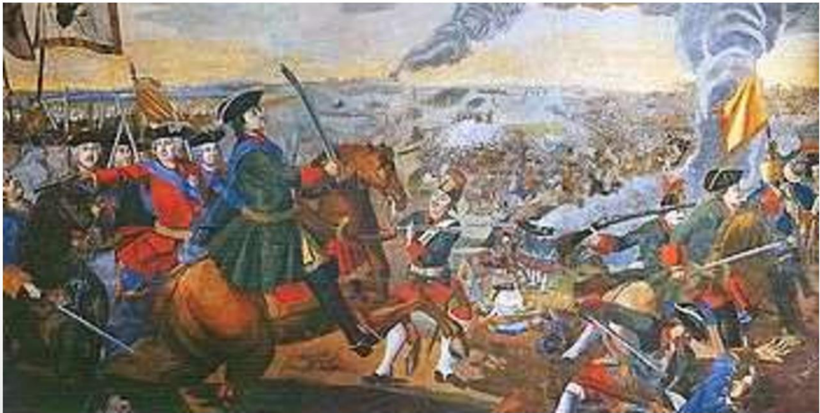
«Полтавская баталия». Фрагмент мозаики М. В. Ломоносова

Битва состоялась утром 27 июня (8 июля) 1709 года в 6 верстах от города Полтавы (Русское царство). Разгром шведской армии привёл к перелому в Северной войне в пользу России и, в результате победы в Северной войне, к концу господства Швеции в Европе.